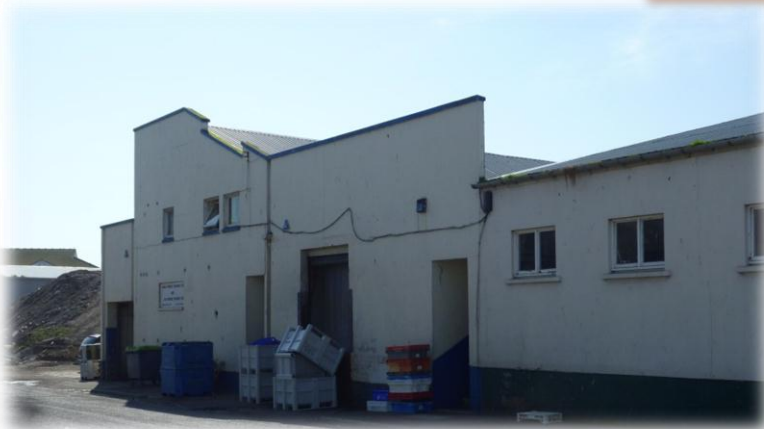
Anglo Nordic Seafoods fabrikk i Aberdeen.

Vi har blitt veldig godt mottatt på fabrikken til Anglo Nordic Seafood. Den første dagen møtte vi opp til avtalt tid kl. 09.00 og vi traff formannen som snakket dårlig engelsk og han forklarte at sjefen ikke var kommet enda. Det ble tatt en del telefoner og vi ble lovet