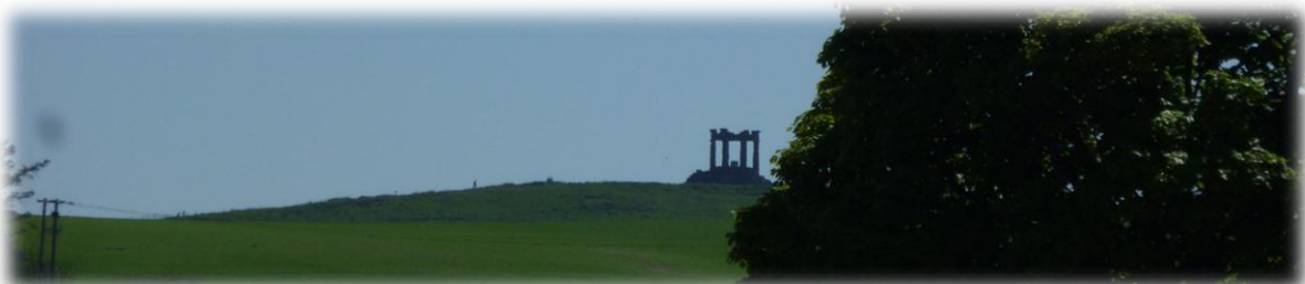
Utsikt fra Stonehaven, en landsby utenfor Aberdeen.