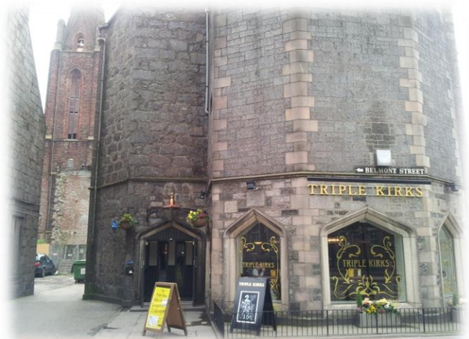
Triple kirks i Aberdeen, en gammel kirkeruin, ombygd til studentpub.

Litt brune har vi blitt både utenpå og innvendig. Her er det Puber og barer på hvert hjørne og i både slott og gamle kirker..!